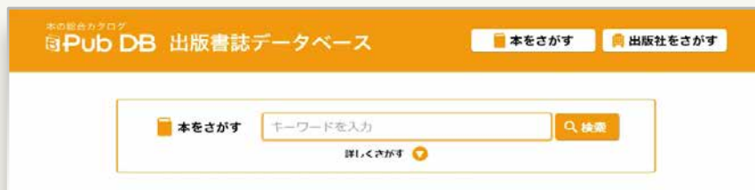
(日本書籍出版協会HP)